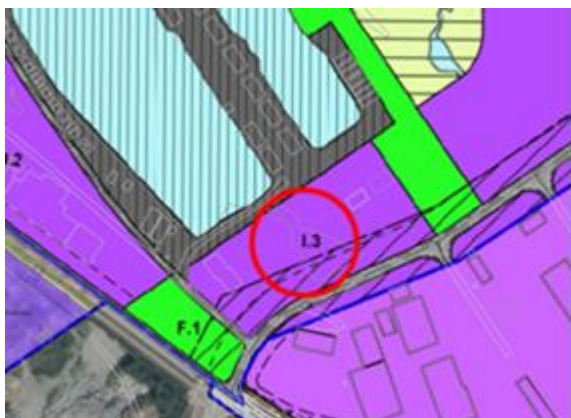
Reguleringsplan 2005. Hele området med keila er regulert til industri.

I forbindelse med mindre endring av reguleringsplan for Håsøran nord foreslo Sunndal kommune å omregulere keila ved småbåthavna fra industri til friområde. Grunnen til dette er å ivareta keila som utløpsområde for overvann og gi mulighet for å utvikle keila som friområde/badeplass.